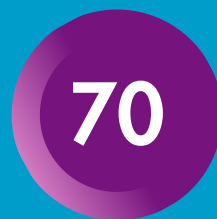
ACTIVITATS DE VACANCES