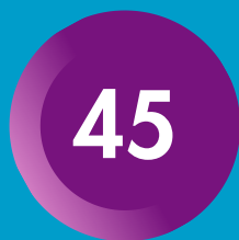
ESPLAI DE CAP DE SETMANA