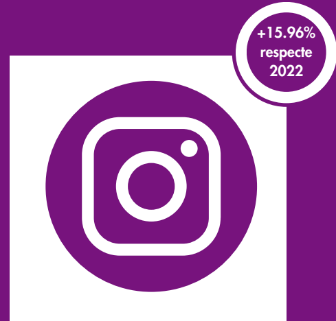
@LaRotllana 1791 seguidors