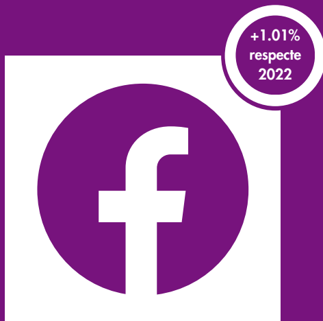
La Rotllana Associació 2573 seguidors