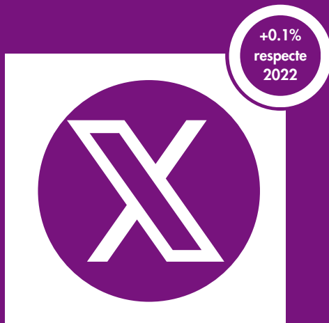
@LaRotllana 1118 seguidors