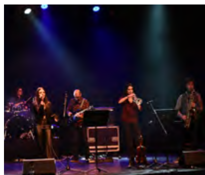
E-MOTIONS (Banda Convidada EMMB)