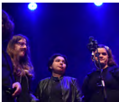
CLAMS (Banda Convidada)