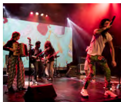
LE BIG SUR (Banda Convidada)