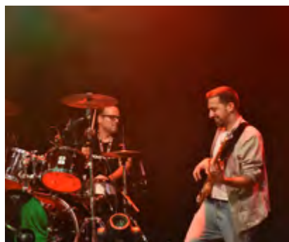
UNIVERSAL ROCKERS (Banda convidada)