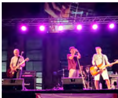
GLITZ (Premi La Cupula)