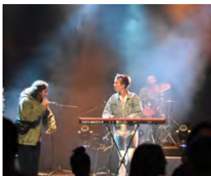
ALTERLATINA (Banda convidada)