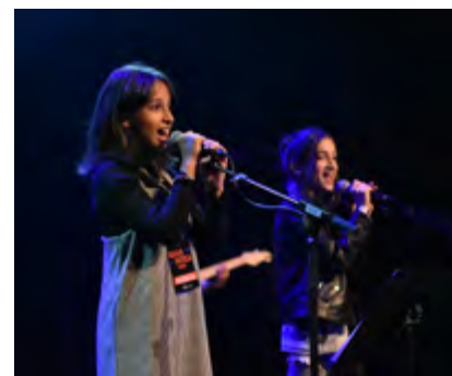
BOTEY BAND (banda convidada)