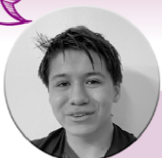
Dilan Grup Adolescents

La formación deportiva me ha ayudado a hablar en público y socializar. Al principio me costaba, ahora los entrenos son fluidos y me lo paso muy bien.